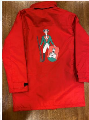
WINTERJACKE ROT DAMEN/HERREN 70 Euro