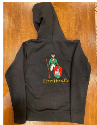
HOODIE-JACKE ROT od. SCHWARZ DAMEN/HERREN 45 Euro