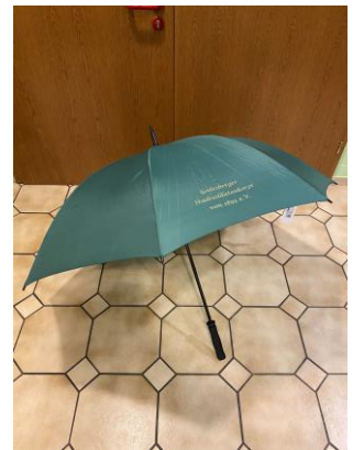
Ähnliches Modell, Details auf Anfrage