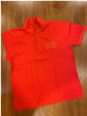
POLO-SHIRT ROT DAMEN/HERREN 35 Euro